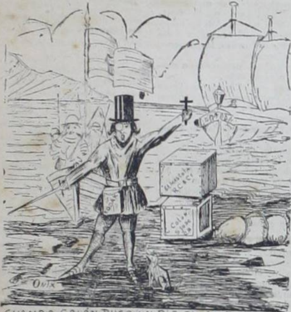
CUANDO COLÓN PUSO UN PIE EN AMERICA, DUDÓ EN PONER EL OTRO; PERO AL FIN LO PUSO y..... NINGUN INDIÓ LE ESPERÓ