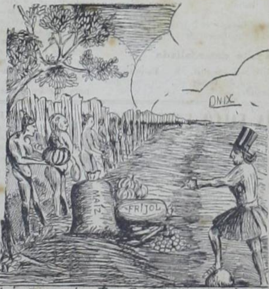
ASI y TODO, COLON TUVO BUENAS IDEAS. IMPLANTO SIN DIFICULTADES LA TRIBUTACION DIRECTA.